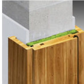
Dämmung der Türzarge