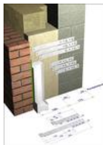
Bild 2: Anwendungsbeispiel illbruck Vorwandmontage-System + FX760 Absturzsicherungs-Lasche